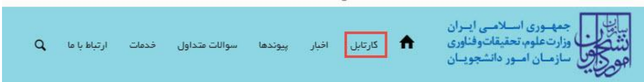
تصویر ۸- کارتابل شخصی

با دریافت پیغام جهت مراجعه به پورتال، برای مشاهده وضعیت خود اقدام نمایید. از طریق پورتال سازمان امور دانشجویان سربرگ کارتابل را انتخاب نمایید. (تصویر ۸)