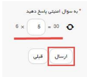
تصویر ۴-سوال امنیتی

سپس به سوال امنیتی پاسخ داده و بر روی دکمه ارسال کلیک کنید.(تصویر ۴)