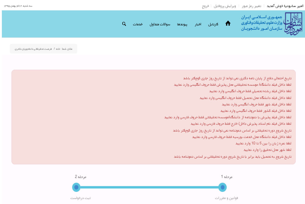
تصویر ۶-اعتبارسنجی فیلد های اجباری

همچنین در صورت وجود مغایرت، سیستم موارد را به صورت تصویر زیر در بالای صفحه نمایش می دهد.(تصویر ۶)